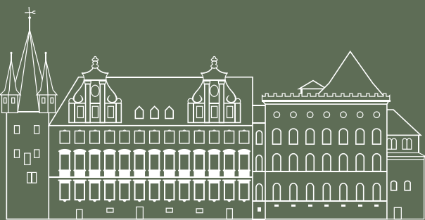
HISTORISCHES MUSEUM FRANKFURT, SAALHOF 1

Bankverbindung: IBAN: DE36 5005 0201 0000 326674 BIC: HELADEF1822