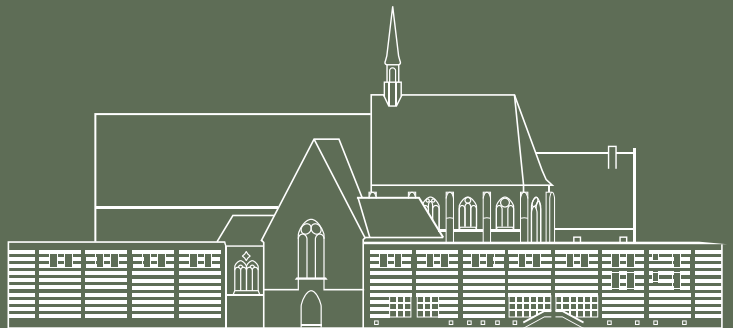
ARCHÄOLOGISCHES MUSEUM FRANKFURT, KARMELETERGASSE 1