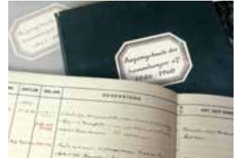
Zugangsbücher des Archäologi- schen Museums Frankfurt

Mittwoch, 18. Juli 2018, 18 Uhr Zum Wohle der Stadt? Ein Antikenmuseum für Frankfurt – ein Plan der NS-Zeit Buchvorstellung: Dr. Dagmar Stutzinger (Düsseldorf) anlässlich des – durch die Stiftung „Deutsches Zentrum Kulturverluste“ geförderten – Ausstellungsprojekts über die systematische Provenienzforschung am Archäologischen Museum Frankfurt mit einer Auswahl an Objekten und ihrer Herkunftsgeschichte 1933-1945. Archäologisches Museum Frankfurt. Eintritt frei, es wird um eine Spende gebeten.